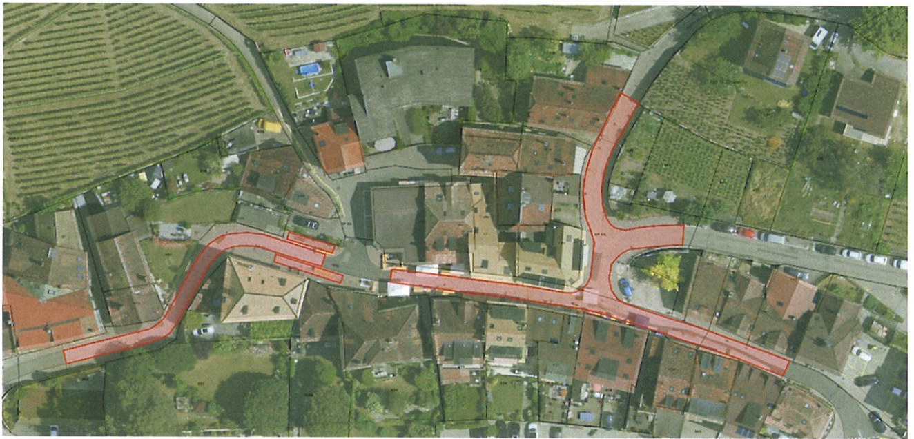
En rouge, la zone de réfection de l'enrobé.