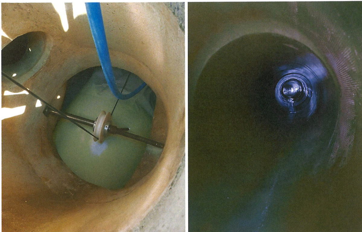
Vue d'un gainage, depuis dessus, dans un regard de visite; Vue intérieure d'une canalisation gainée.

Par ailleurs, la Municipalité a engagé une démarche participative, afin d'associer la population à la réflexion sur l'aménagement du cœur de Corseaux. Cette démarche a pour objectif, à terme, d'alimenter les réflexions globales sur l'aménagement de ce secteur.