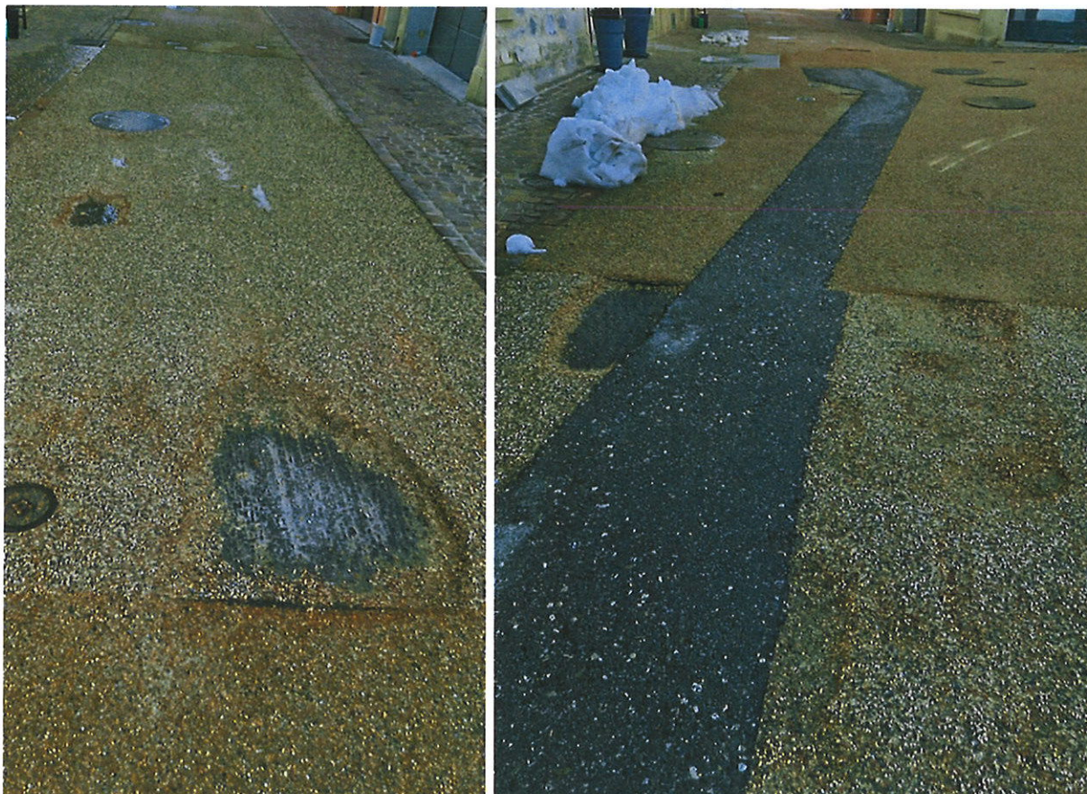
Différentes dégradations de la chaussée de la rue du Village.

Parallèlement, la nécessité de rénover les collecteurs d'eaux claires et d'eaux usées est apparue : une intervention s'impose à court terme, afin d'assurer le bon fonctionnement des collecteurs et de prévenir toute détérioration future. Les inspections ont mis en évidence que ces conduites sont fissurées, par endroits, et présentent une porosité, entraînant des risques d'infiltrations et de dégradations ; de même, les conduites des eaux usées présentent, à long terme, des risques. Leur état structurel général permet toutefois une réhabilitation par gainage (chemisage) intérieur, solution techniquement adaptée et économiquement pertinente.