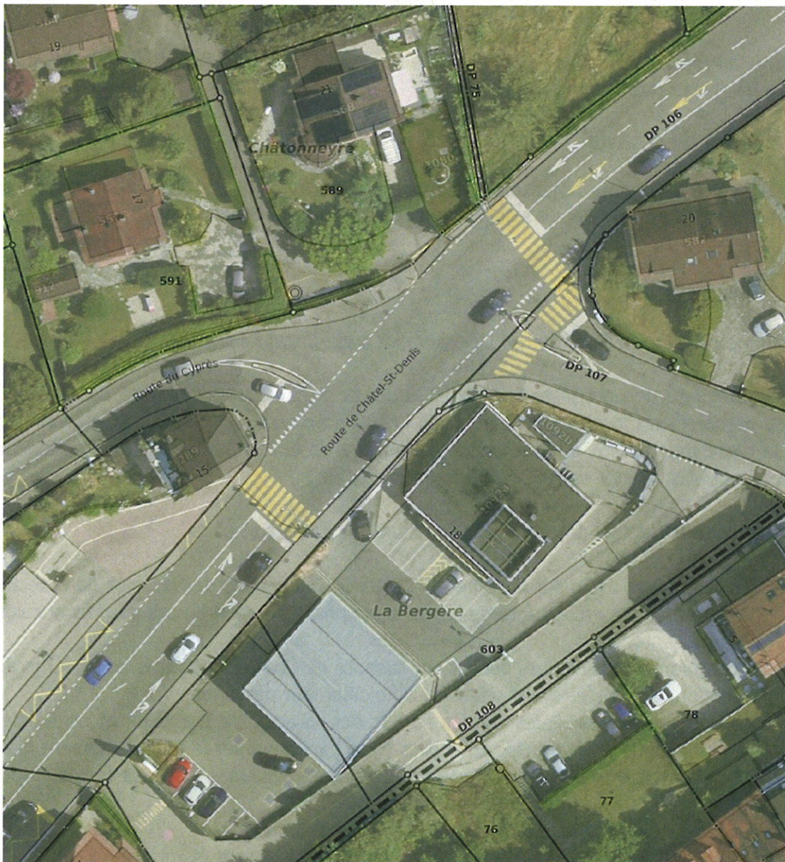
Extrait Cartoriviera – Carrefour du Délassement

Cette étude, qui définit le fonctionnement général et est mise à jour à chaque complément réalisé, est toujours valable aujourd'hui, le système de circulation n'ayant pas évolué depuis 2019.