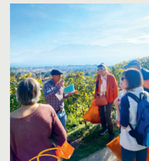
Recherche de plantes envahissantes

Les balades et activités proposées dans le cadre de cette semaine de la durabilité ont été très appréciées par son public.