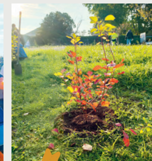
Plantation de 12 arbres au Parc Chaplin