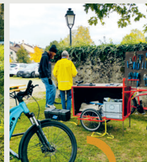
Atelier réparation de vélos