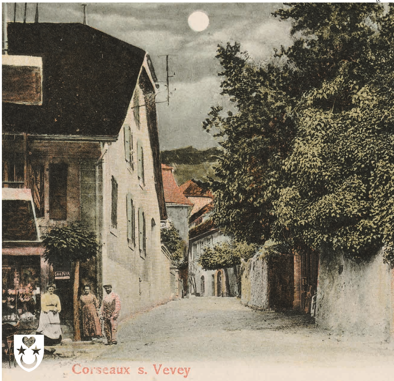
Corseaux s. Vevey